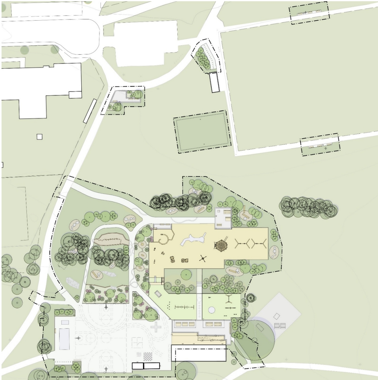
Figur 5: Situationsplan för utvecklingen av Hässelängens parklek