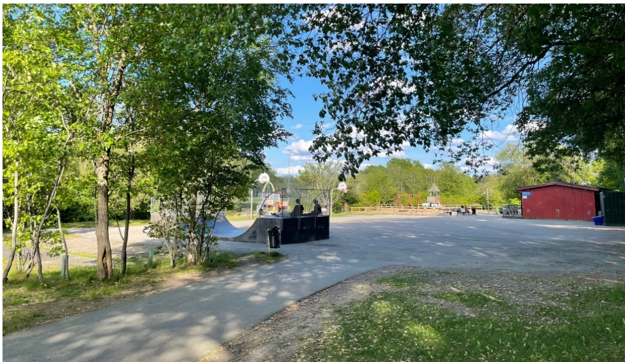
Figur 2: Fotografi från ingången till parken från sydväst. I förgrunden syns den befintliga skaterampen. I fonden ligger parkleksbyggnaden.